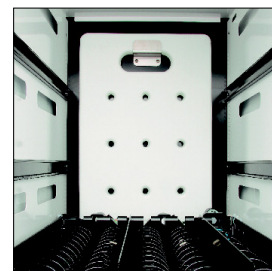
Ijsplaat die de producten langer koel kan houden in geval van een stroompanne